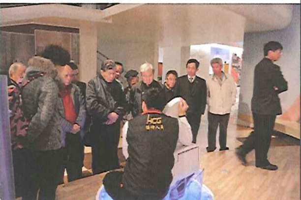
介紹和成衛浴設備