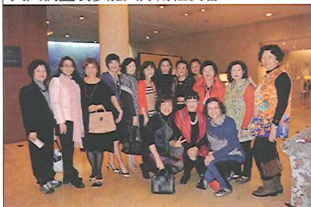
夫人們盛裝參加大分南社例會