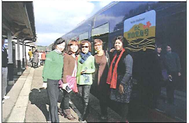
搭乘里山里海號火車