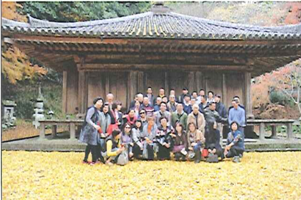
與大分社社友合照