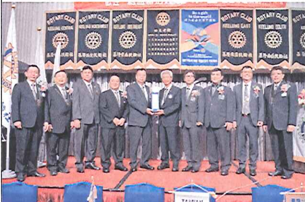
感謝 Tea PP 協助設置中元祭服務台