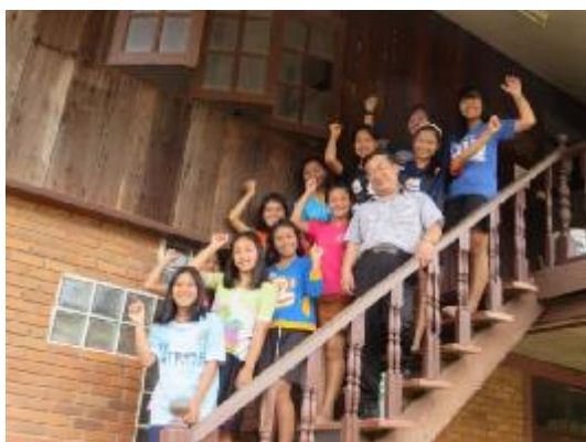
併せて子供たちの喜ぶ姿を添付します