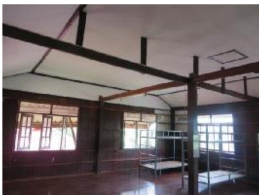
工事完成間近の女子寮天井です