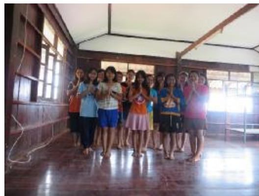
子供たちのお礼の写真を届けます