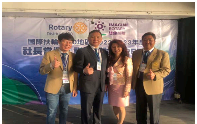
▶3/18 PE Sky、下年度花蓮二分區 DVS Freezer 前往淡水福容大飯店參加社長當選人訓練會。