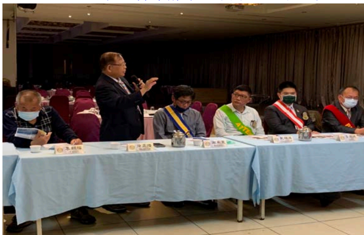
▶Dentist PP 報告光復國小圖書館全球獎助金申請流程及進度。