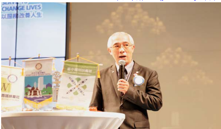
▶110.11.13 參加兄弟社台中中區扶輪社授證 42 周年紀念慶典。