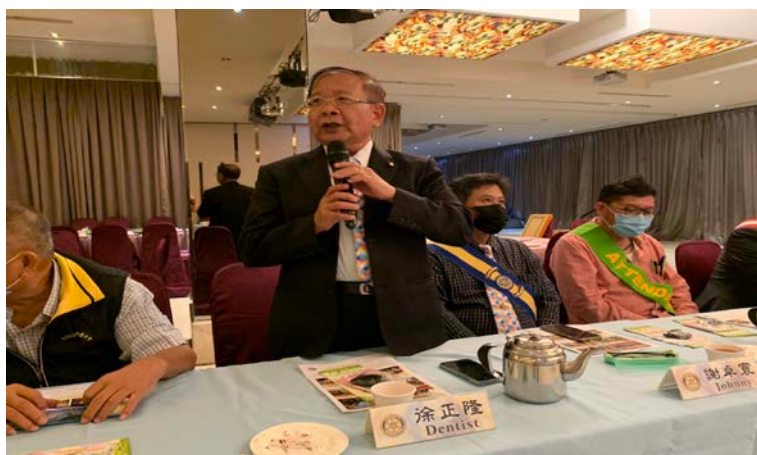
▶Dentist PP 總結今晚專題演講。