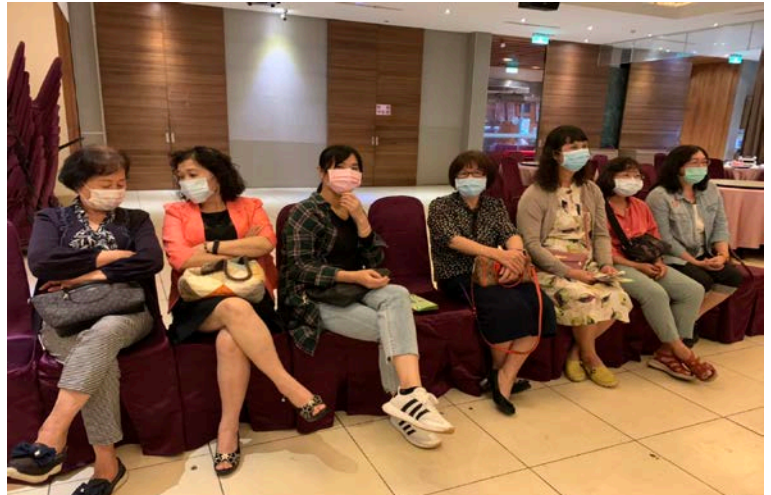
▶歡迎寶眷蒞臨出席例會。