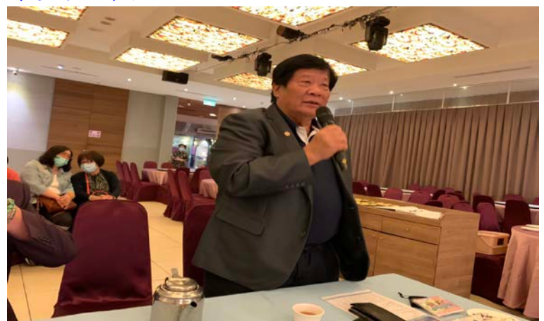
▶Shovel PP 分享因工程保險透過協調會補償之經驗