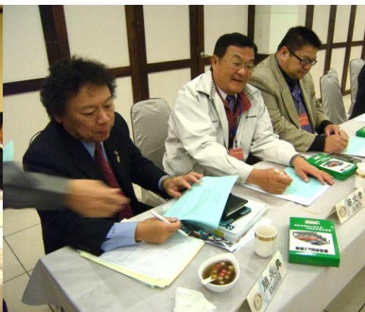
※第 29 屆社員大會選舉花絮