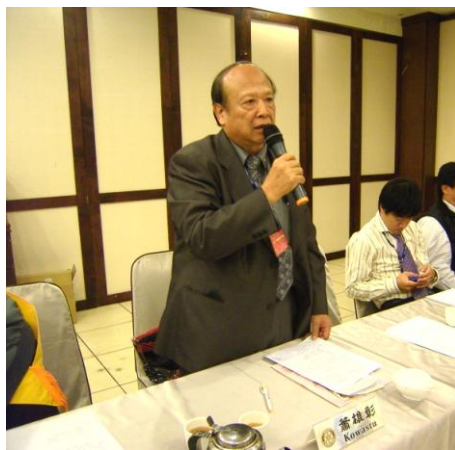
※Kowastu pp 講解社員大會的意義