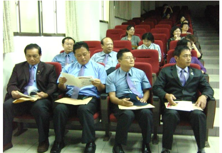
9/21社長及二分區助理總監、社長及社友參加本年度簡易獎助金-花蓮縣偏遠鄉鎮地區國小口腔潔牙觀摩會及衛生保健推廣計劃講習會開訓儀式，地點：花蓮縣鑄強國小階梯教室。