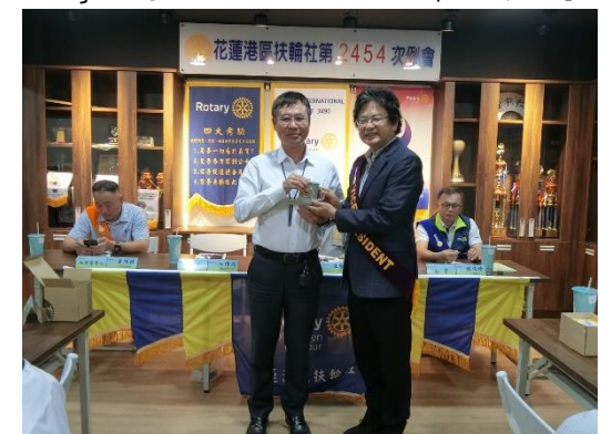
PP Elephant 拍得 Doson 出國帶回之紀念品