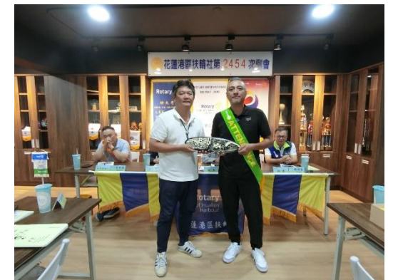
Esing 拍得 IPP Noodles 出國帶回之紀念品