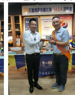
社當拍得 Kuber 出國帶回之紀念品