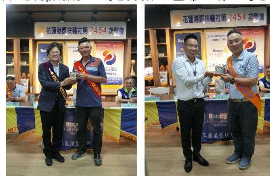
紀念品贈 PP Eagle