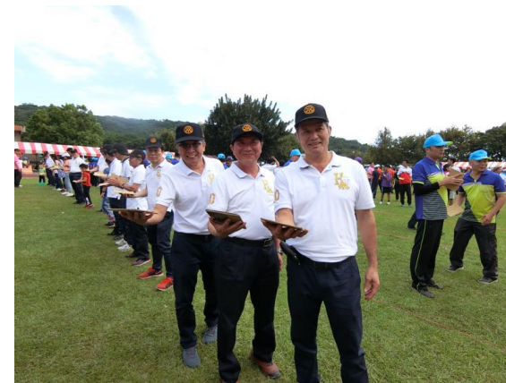
趣味競賽—超級快遞