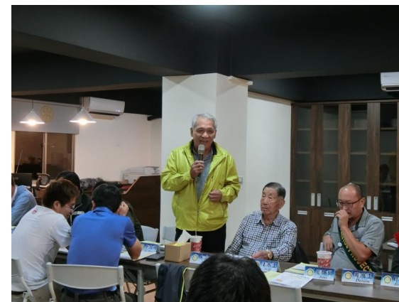
PP Telephone 分享近況