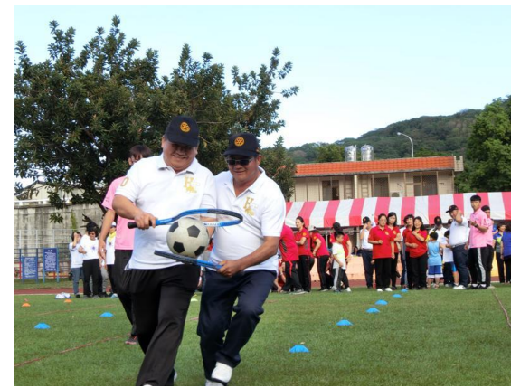
趣味競賽—旋轉 360 度