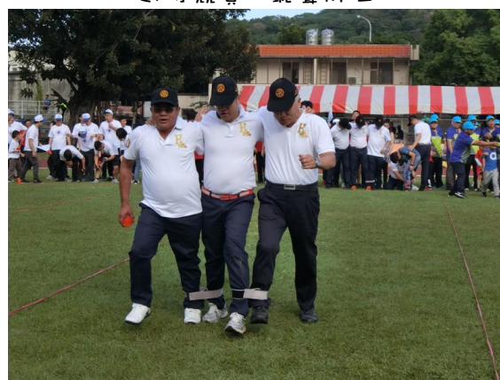
趣味競賽—跑跑大連線↓