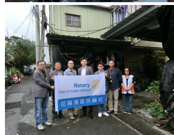
11/6 與世界展望會訪視個案戶↑↓