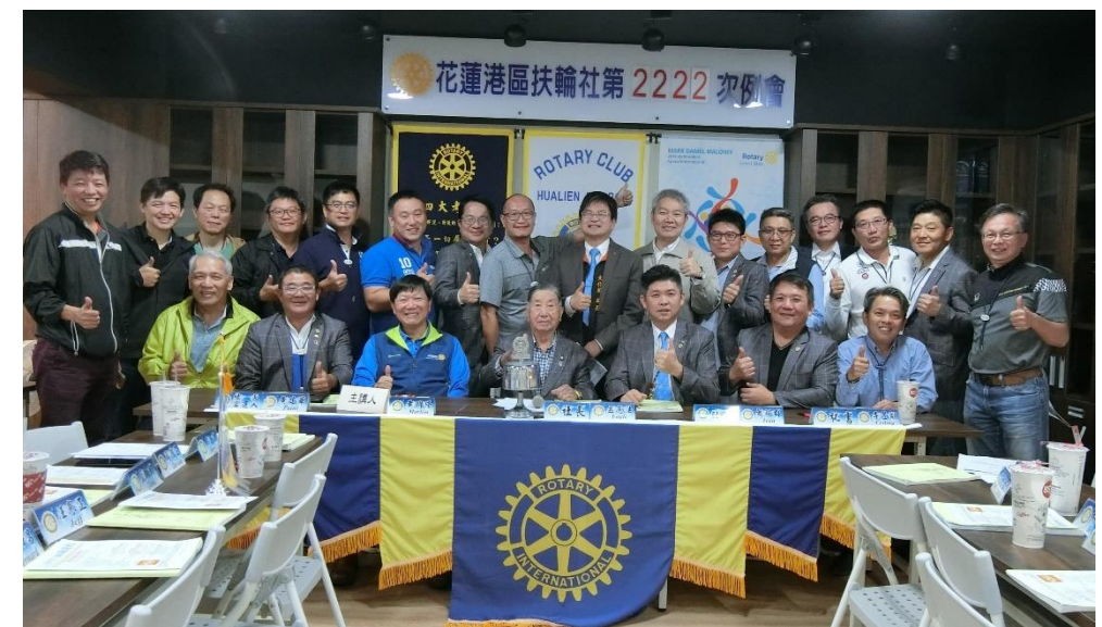
歡喜 2222 次例會