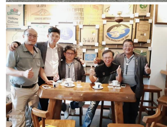
訪視後社長請喝咖啡