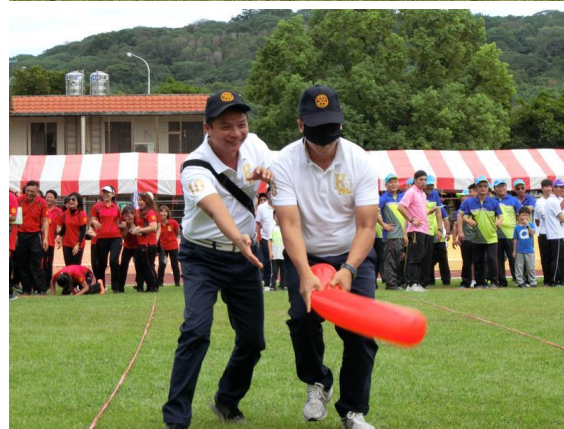
趣味競賽—聽聲辨位