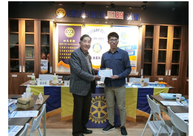
頒發了月份獎學金