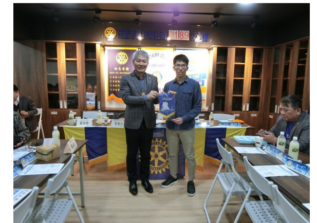
社長代表贈送中華扶輪受獎生社旗