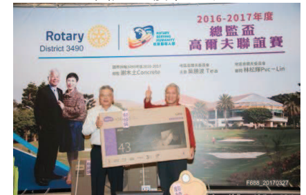
恭喜 PP Telephone 抽中 43" 液晶電視