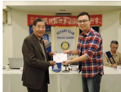
PP Bernard 頒發中華扶輪受獎生 2-3 月獎學金