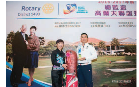
恭喜 Better 獲個人總桿第二名佳績