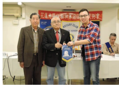
社長代表致贈社旗