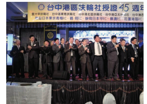
一曲你是我的兄弟做最後 END