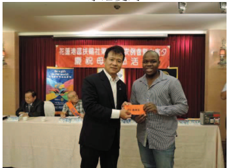
頒發 Inbound 學生 5 月份獎助學金