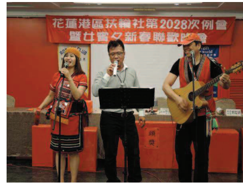
社長與5年級合唱團