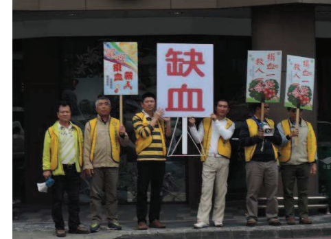
社長帶領社友於街頭勸募捐血