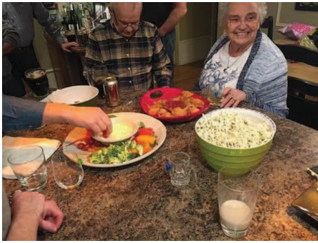
陪轟家去跳 Square Dance