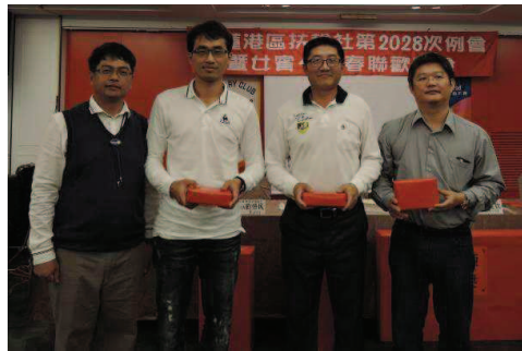
摸彩活動 ↓ ↑