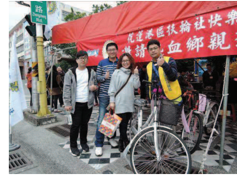
恭喜幸運捐血人-Better 夫人抽中腳踏車