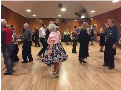
跟顧問家人一起吃飯