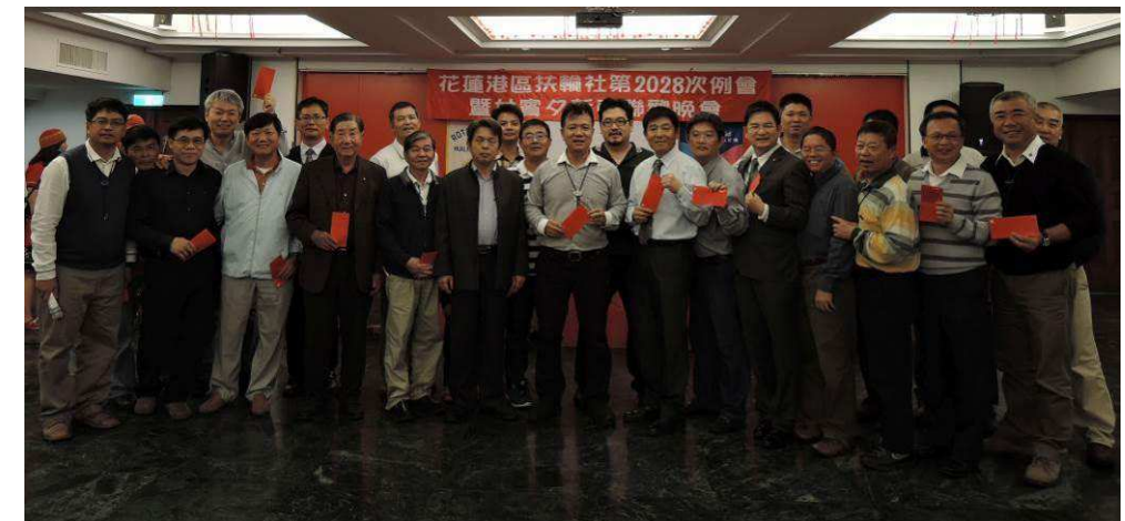
表揚第二季出席百分百

2016 FEB 第 39 卷 中華民國 一 0 五 年 二 月 二 十 二 日 第 30 期