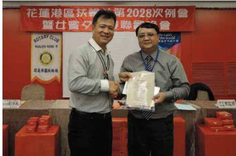
歡迎生力軍-A Ming ↓ ↑