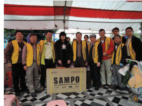
恭喜幸運捐血人抽中大獎-液晶電視