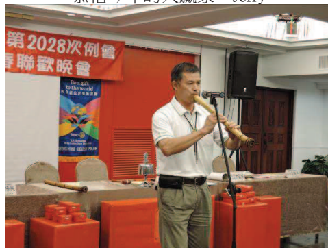
PP Engine 洞蕭表演