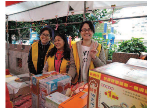
感謝夫人們協助捐血活動