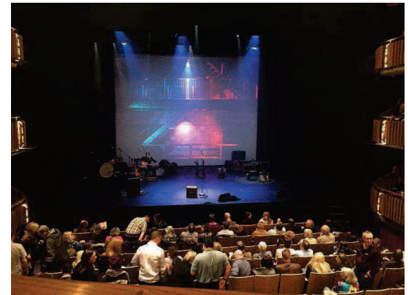
扶輪社社友帶我去看 LiveShow

在語言的學習上，現在已經可以很明顯感受到自己的口說進步很多，之前說話的時候都還要經過腦袋翻譯才說的出來，現在可以很輕易地就說，但文法的部份還是需要一些時間去改。