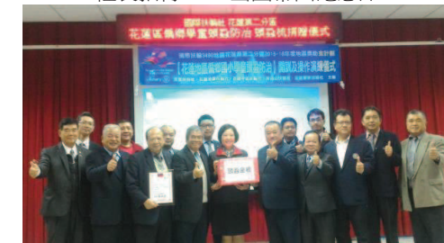
花蓮二分區地區獎助金開訓典禮