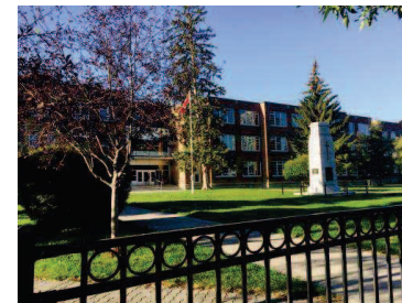
第一次一個人走路到學校

卡加利這個城市真的很棒，走進每一家店，店員都會主動跟你問好並且都帶著微笑。在這邊生活總是會聽到”Thank you”或者”Have a nice day”就是很有禮貌的向你問好，並且希望你今天一切過的順利美好，車子總是以行人優先，就算沒有紅綠燈他們也會主動停下並且指示讓你先過，真的是很有風度的國家。就算每個人不認識對方一對到眼就是微笑，這裡根本是天堂啊！！