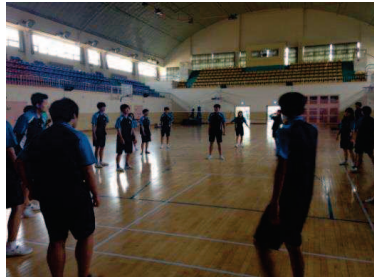
上體育與同學打躲避球