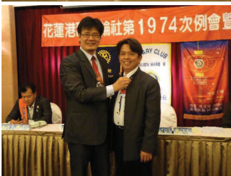
佩戴 RI 社員成長貢獻表彰↑↓