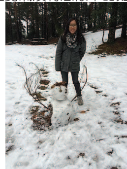
和轟媽一起堆的雪人

生活感想： 這個月初因為在巴黎發生槍擊事件，身為學生當然還是正常到學校上課，但是在任何一堂課打完鐘，大家進教室後，所有老師開口說的第一句話就是，昨天是令人震撼的一天也非常感傷，而你們對這件事有什麼看法，大家開始舉手發言自己內心的看法，甚至開始進行辯論。在台灣在學校中很少有全班一起辯論對自己國家當時發生的事情和進行討論，大部份的老師都總是告訴我們要好好準備段考，下次不要再考差了，老師因為進度的壓力，而在這裡老師寧願花超過一節課的時間讓大家舉手發言。對台灣的學生來說舉手發言是一件很困難的事情，但在這裡是一件再正常不過的事情。台灣的學生好像少了點膽量，其實我們有和老師辯論的權利，勇於提出自己不懂得東西或是提出自己的看法。這好像就是我們需要學習的地方。雖然我天生膽小，但我覺得膽量是可以訓練的，從小不太敢和不熟的人講話，可以在補習班一整個學期沒有和坐在隔壁的同學講話，但現在我可以很容易的就和外國人說話，現在在學校也可以有問題要和老師討論，可以主動舉手，可以在英國旅行的時候和同學在倫敦街頭一起和街頭藝人跳舞，鼓起勇氣沒有想像中的難，而且能體驗更多不同的經驗。