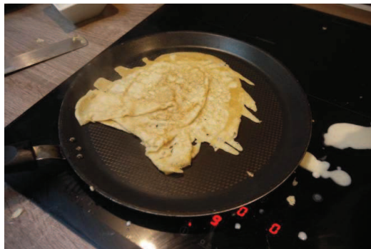
跟著扶輪社一起參加音樂會 雖然餅皮掉到地上了，但是失敗為成功之母，總有一天我要成功