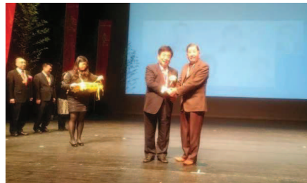
中華扶輪獎學金頒獎典禮~冠名捐獻↓↑