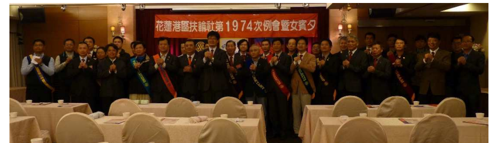
錄製洄瀾賀歲節目

2015 FEB 第 38 卷 中華民國 一 0 四年 二 月 九 日 第 29 期