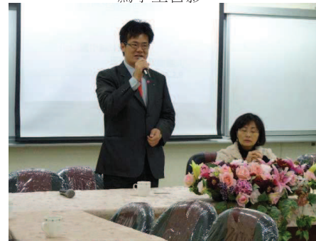
社長致詞期勉化仁國中棒球隊