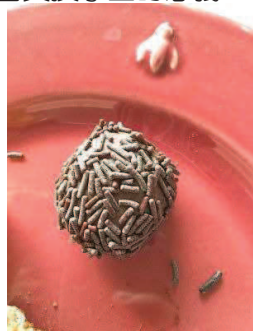
我最喜歡的甜點巴西的！