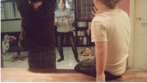
和轟家玩比手畫腳，法文版

目前每週1次2個小時的語言學習課程。我覺得效果不錯，上了課之後能夠跟更多的法國人正常聊天，也可以用正常的文法了，但是每次去上課，他們都是強迫性的要求我記住更多的單字，給了我龐大的壓力，不斷地塞單字給我，多到我的腦袋有點應付不來呀，說實在的真的有點痛苦但是有成效。