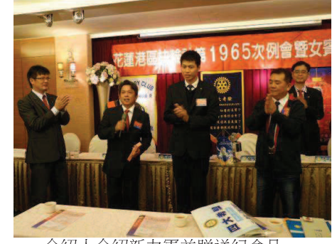
介紹人介紹新力軍並贈送紀念品