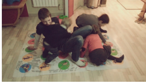
和轟家玩踩顏色的遊戲