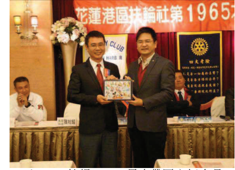
PP Elephant 拍得 Doson 日本帶回之紀念品