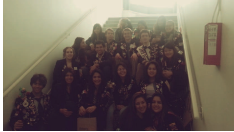
地區扶輪社的聚會，大家佔據樓梯間在聊天