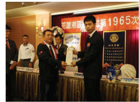
助理總監代表總監贈送紀念品