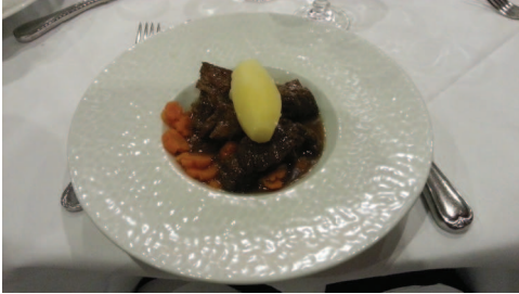
扶輪社例會時吃的主食