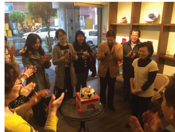
乙皮畫廊為 Chaucer 夫人慶生