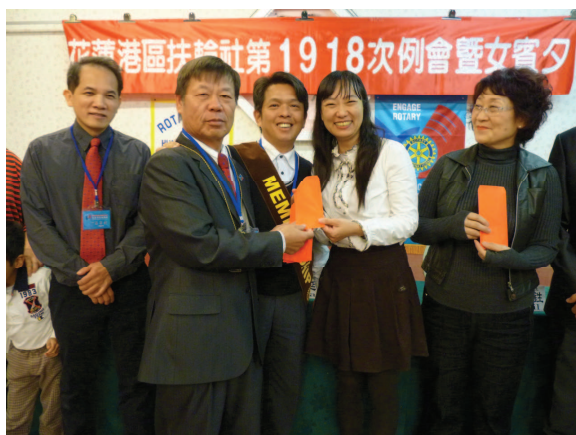
永浴愛河 ↓ ↑