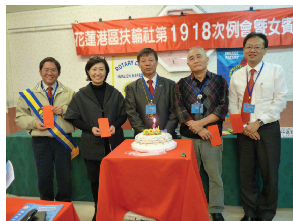
生日快樂 ↓ ↑