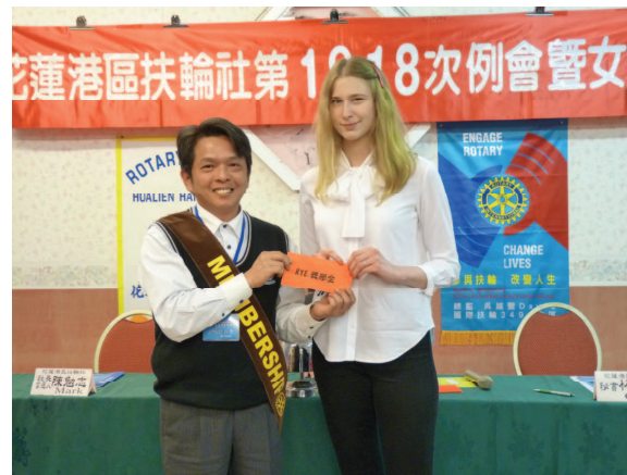
由接待家庭頒發交換學生 1 月份獎學金 ↓ ↑