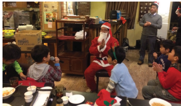
聖誕老公公與小扶輪 ↓ ↑