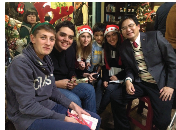
IPP Elephant 與交換學生合影