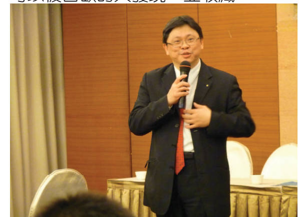
社友 Chaucer 職業分享

年很漫長的過程，且需要8-10億美金，這就是原廠藥物都很貴的原因。 藝術的部份 ～1985年認為大學生活必須彩色，就到公館學畫，做法變成我夫人的牽手，與花蓮比較密切是～開了乙皮畫廊，是希望藝術可以讓我們的更豐富，讓不管是出生、被花蓮吸引或感受花蓮的特別來做藝術創作的作品可以被喜歡的人發現、並收藏。