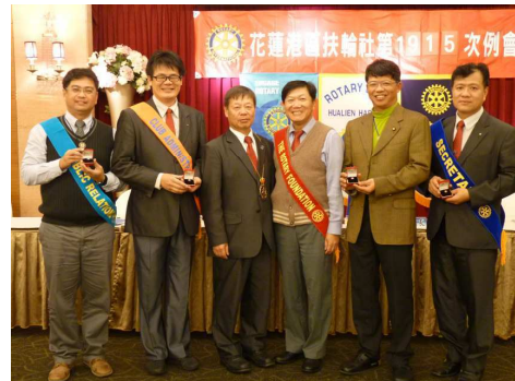
↓ 頒發 2013-14 年度中華扶輪基金捐獻表彰