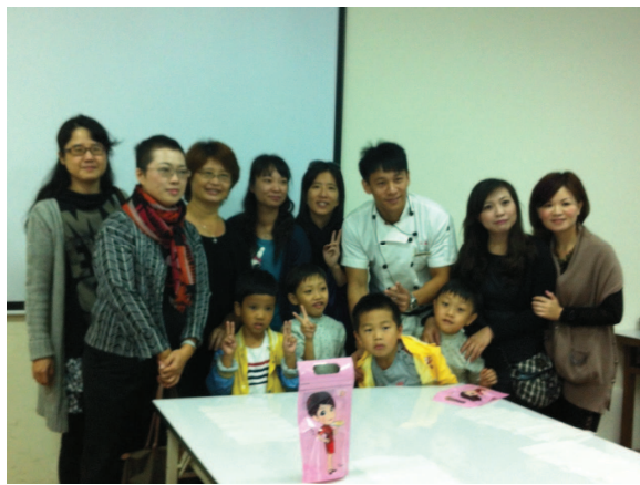
宜蘭 1 日遊