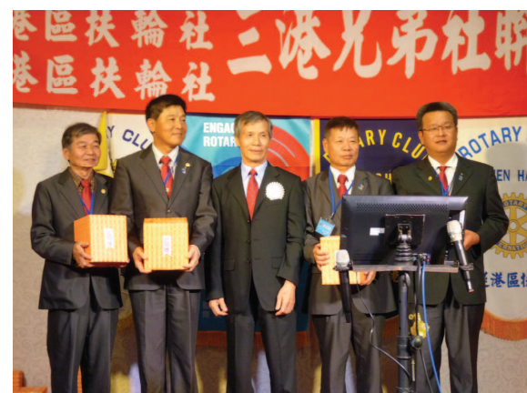
三港高爾夫球聯誼賽頒獎 ↑ ↓