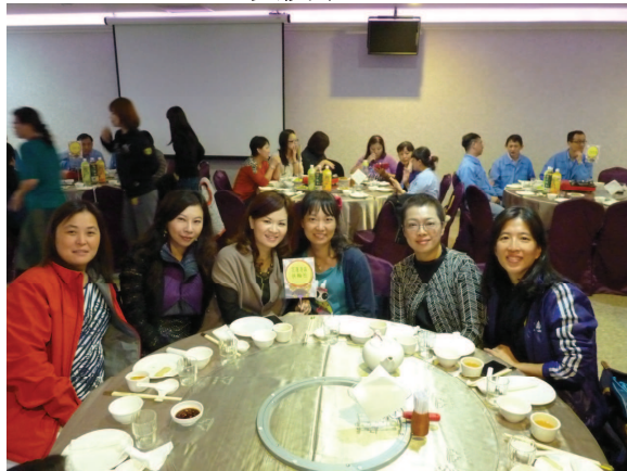
三港聯合例會會場合影 ↓ ↑