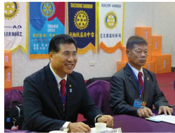
三港聯合例會～社長與 IPDG Young