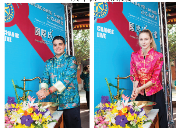
RYE 成年禮—金盆水洗手