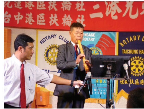
三港聯合例會聯誼時間～社長洞蕭表演