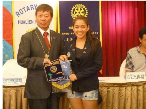
歡迎 2013-14 Inbound 學生 ↓ ↑ ↗