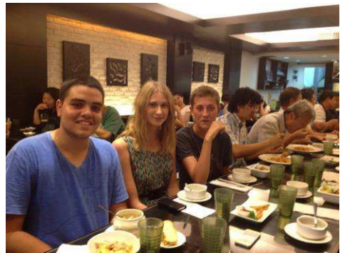
RYE 2013-14 Inbound 學生歡迎會