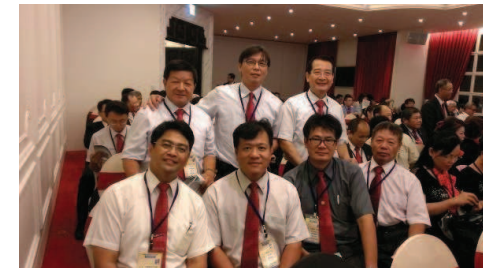
7月27日參加公共形象研習會並與蘇澳社參加社友合影