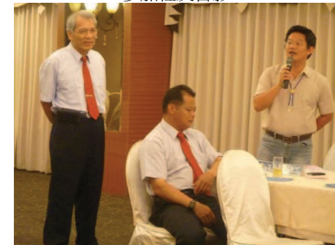
扶輪知識時間 Noodles 分享參加扶輪社的好處