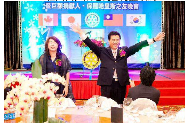
總監伉儷於晚會向大家致意