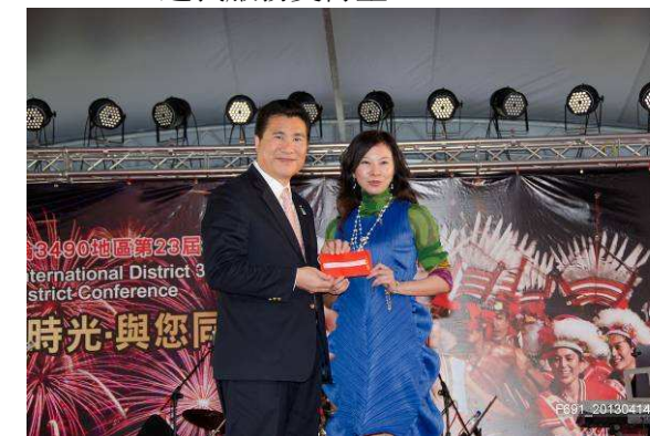
扶輪之夜表演獎金$1500 元