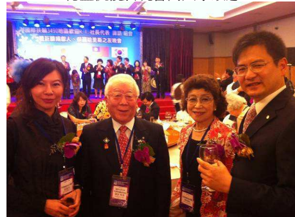
社長伉儷向 RI 社長代表伉儷敬酒