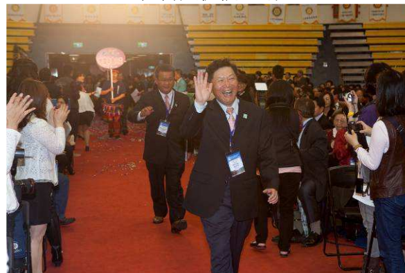
財務長及總務長入場