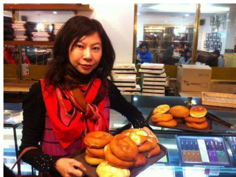
有名的群山紅豆麵包