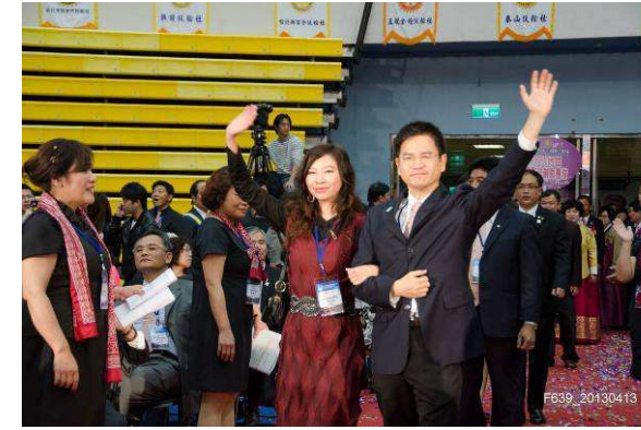
社長 Elephant 伉儷入場