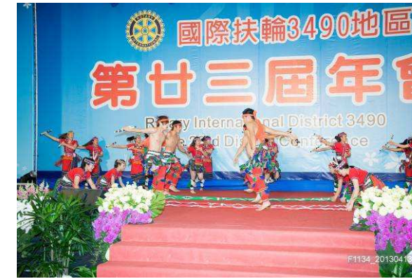
花蓮原舞扶少團的用心表演