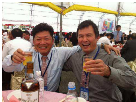
未來新總監及秘書長