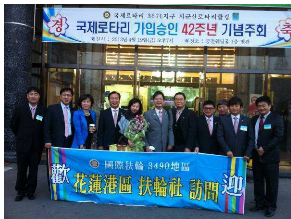
西群山社友盛大的歡迎