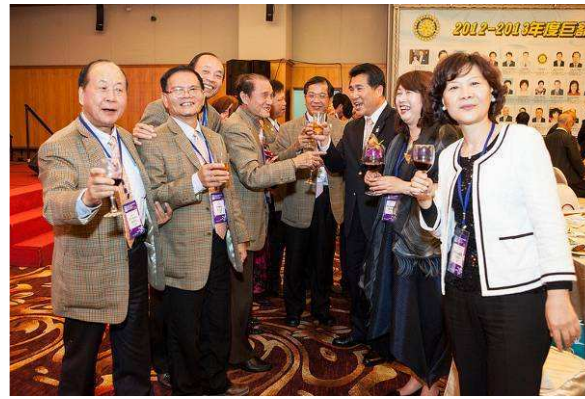
熱情的兄弟社—台中港區扶輪社