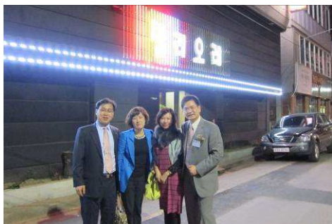
與元相然前社長伉儷合影