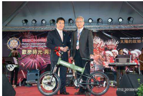
扶輪基金抽獎—腳踏車 1 台