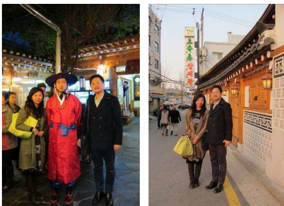
↑ ↓ 抵達當晚土俗村有名的參雞湯晚宴