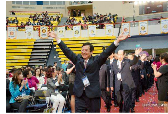
兄弟社—蘇澳社入場