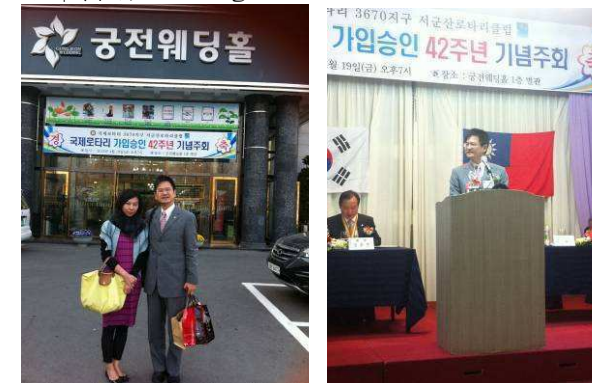
↑ 社長於慶典上致詞