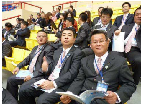
社友踴躍參加年會