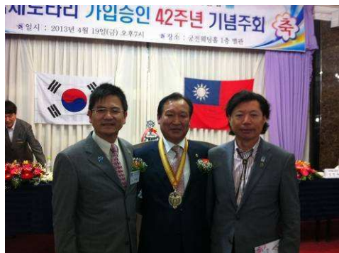
與西群山金社長、濟州社康社長情同手足