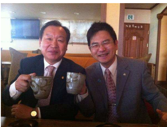
西群山金社長請喝下午茶