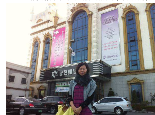
↑ ↓ 會場 Wedding Plaza