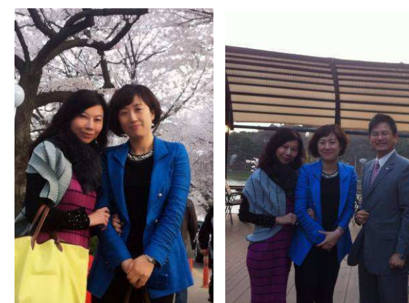
元相然前社長夫人請喝群山市有名咖啡 ↑