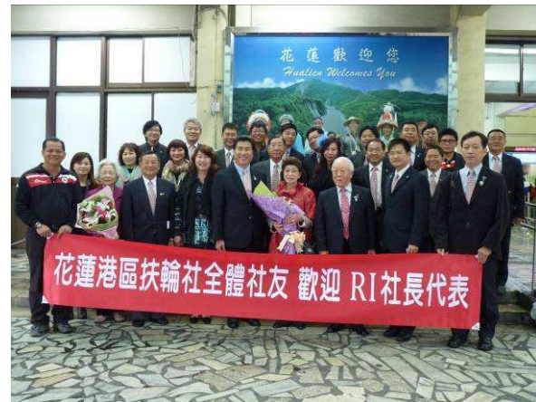
本社社友及夫人歡迎 RI 社長代表