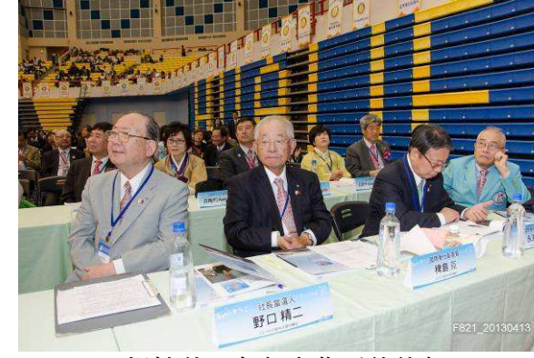
姐妹社—久留米北區社社友