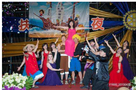
社友及夫人同心協力表演