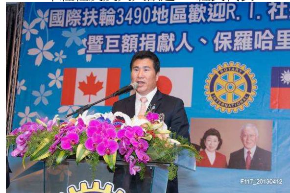
RI 社長代表歡迎晚會總監致詞