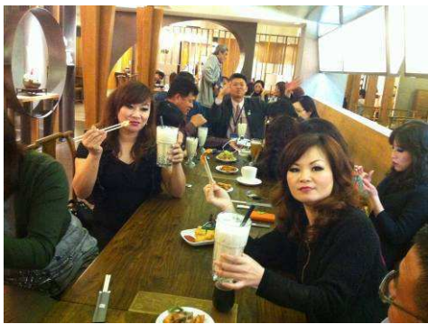
社長會後感激慶功宴