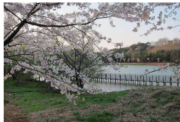
正逢群山櫻花季 ↑ ↓