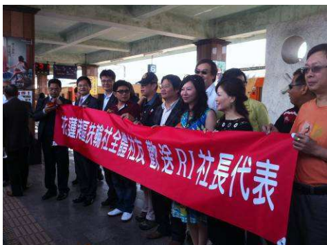
歡送 RI 社長代表