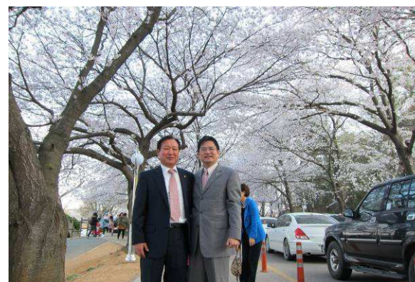
與金社長在櫻花林下合影