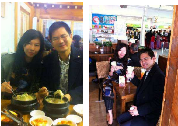
3 個半小時的旅途中休息站小憩 ↑ ↓