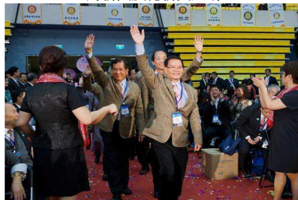
兄弟社—台中港區社入場