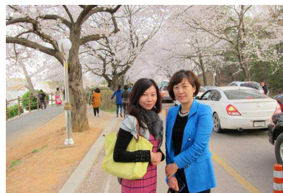
社長夫人與元相然前社長夫人相見歡(在櫻花樹下合影) ↑ ↓