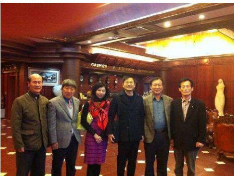
早餐會與金社長及前社長們合影