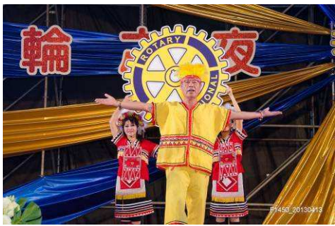
港區未來超級巨星