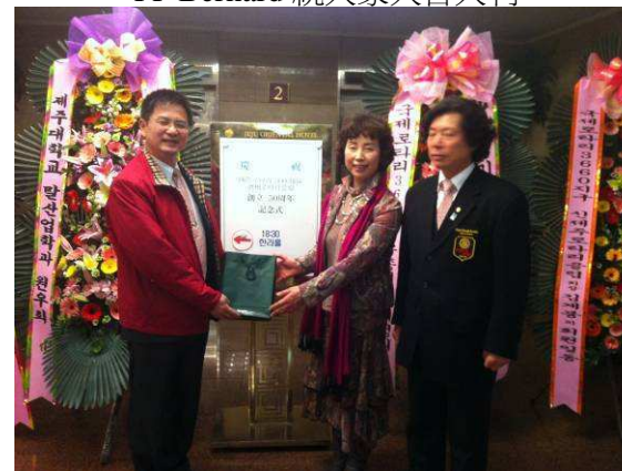
康社長及夫人致贈禮品