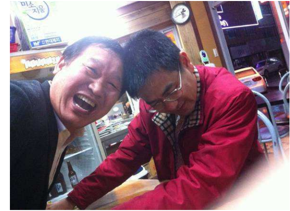
與西群山社會後的消夜