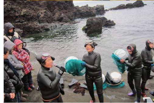
海女的下海捕魚秀