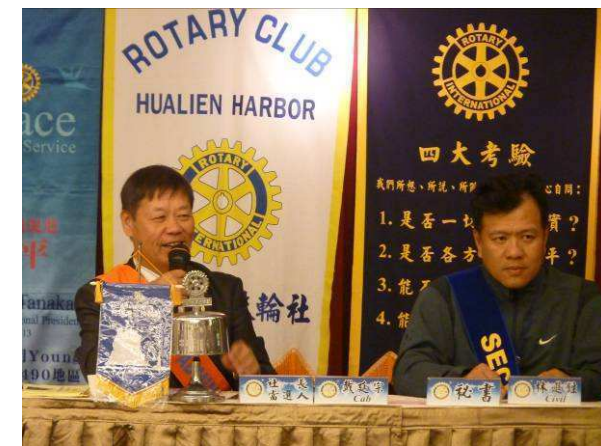
下年度團隊代理主持會議