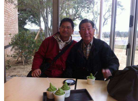
茶博物館的綠茶冰淇淋 ↑ 民俗村 ↓