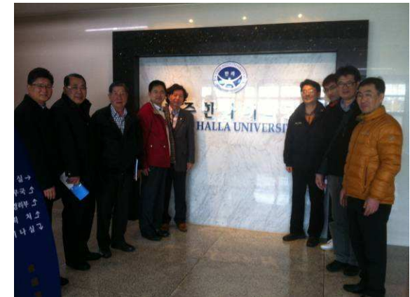
漢拿大學與教務長相見歡