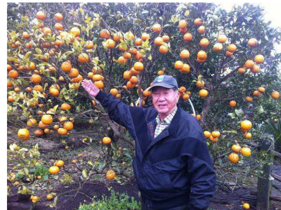
PP Bernard 祝大家大吉大利