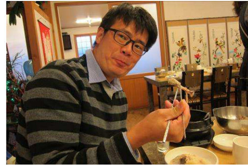
韓定食與人蔘雞 ↓ ↑