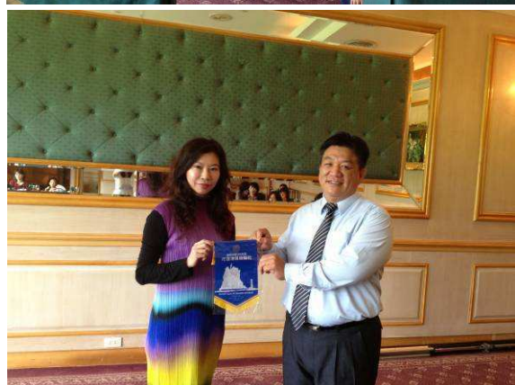
內輪會會長代表致贈社旗感謝主講人