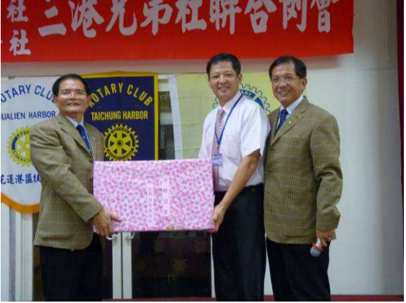
三港高爾夫聯誼賽-Golf 獲淨桿冠軍