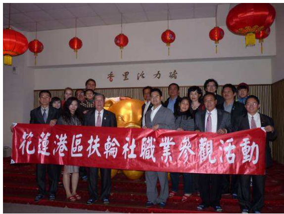
職業參觀-香里活力豬觀光工廠