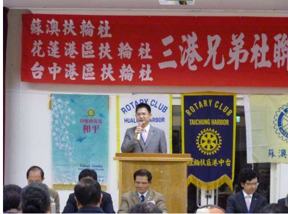
三港聯合例會社長 Elephant 致詞