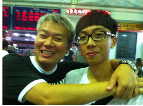
慈顏老父，笑在臉上心在滴血