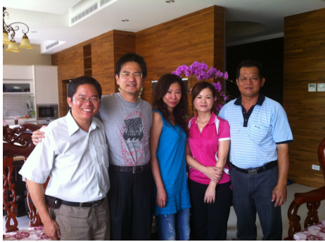
恭賀 Water 夫人生日快樂、心想事成