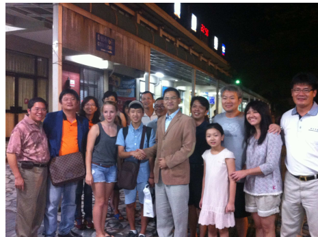
社長親自給予 YEP 學生鼓勵與祝福