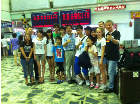
社友及夫人車站歡送 Yochih 小扶輪 前往比利時