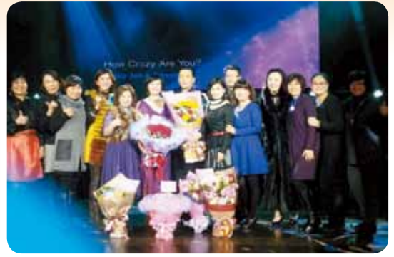
感謝P.E. Nicole及尊眷E-BUS邀請新南姊妹們參加又送大家禮物