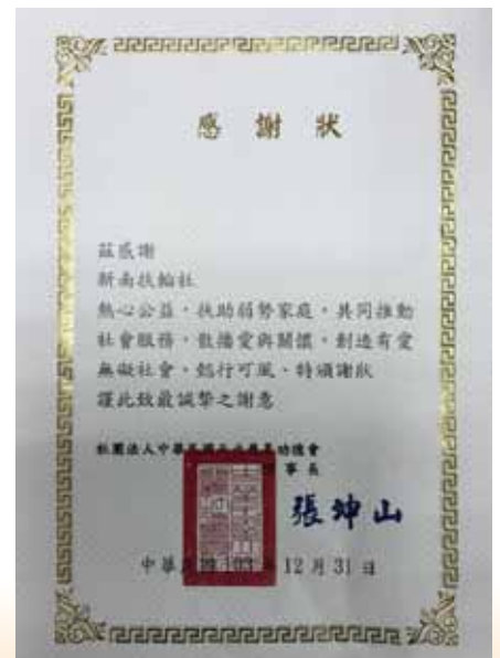
PP Music捐贈3000個口罩予三個社服單位 (鵬程啟能中心、盲人重建院、社區精神復健協會)