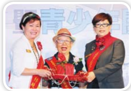
CP Mayor見證歷史性的一刻 新舊任社長交接