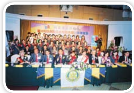
703社長暨新任職員就職典禮暨感恩餐宴圓滿成功新南航空即將起飛 航向璀璨的未來！