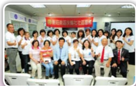
溫馨的聯合社區服務 圓滿成功 姊妹們與貴賓齊合影

親愛的社友們，在此要為兩個單位做一下工商廣告。如果想買淨水機，可別忘了親切和藹的PDG Trading家的超強生命能量水機喔。若想做社區服務，康復之友協會也是個非常值得協助的團體呢。