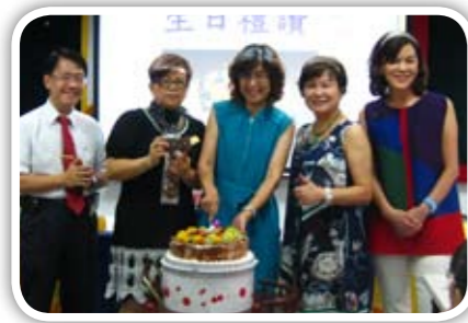
社長祝社友及尊眷們大家生日快樂