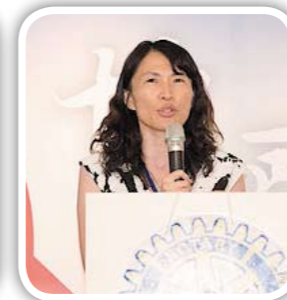
PP Sharon擔任講師 倡導如何由社區服務結合公益網平台提升扶輪公共形象