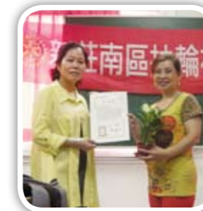
PE Flower除了帶給小朋友豐富的知識還送每人一盆小盆栽 小朋友都好開心