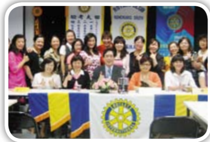
感謝社長及節目主委如此用心的安排 例會圓滿成功！