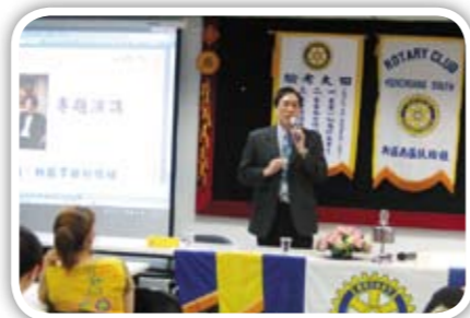
本尊好年輕喔 大家都以為主持這麼多年電台 應該是個鬚髮盡白的LKK 呢 結果 竟是大帥哥呢...