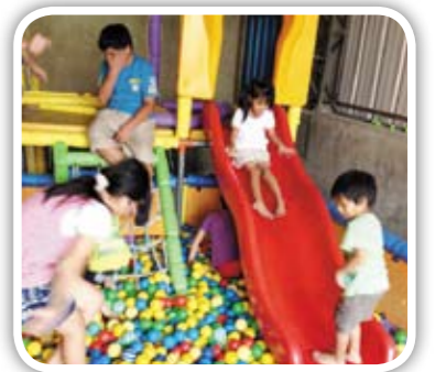
基督教協會球池照片

感謝 GIVE543 贈物網與新莊文鶴幼稚園 (PP Music 場地移作他用 所捐贈)，捐贈碎紙機、烘碗機、書櫃、四層櫃與孩子最愛的聖誕樹與掛飾，謝謝您 - !