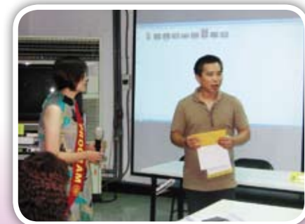
阿德老師與大家分享了許多精采的影片