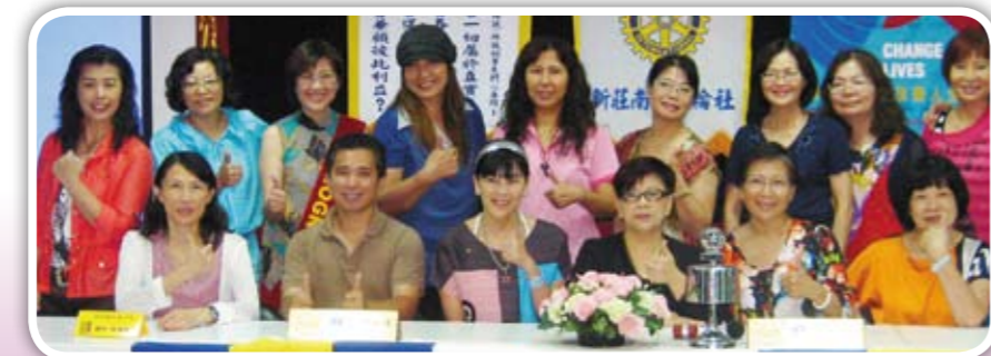
謝謝老師讓我們重新發現台灣之美