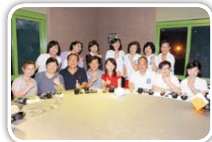
六本木餐廳社長招待爐邊會 饗宴精緻又有貴客相陪(羅東中區社長Coffee及PP Tennis賢伉儷)