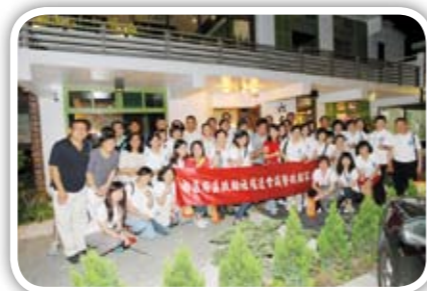
父親節活動 社友及寶眷們出席踴躍 活動圓滿成功 讚!