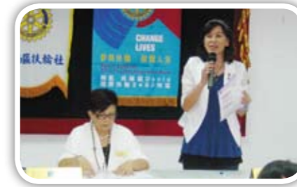
感謝 AG 大人為大家分享 RYE 的知識