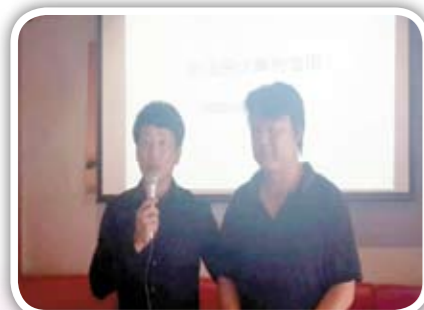
這是多麼可怕的事“台灣治安通報系統最小吸毒者是9歲”藥物濫用已是治安最大的毒瘤。毒品造成的傷害除了自己也傷害了愛你的家人