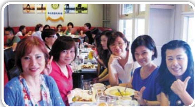
勇敢的跟毒品說“不” 才会有美好的人生唷