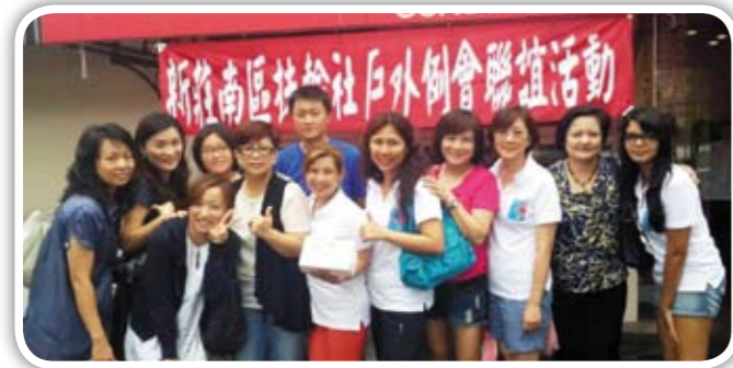
把這份愛傳遞下去