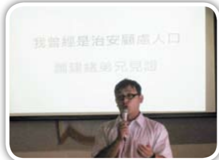
更生人重生後的現身說法 令人感佩