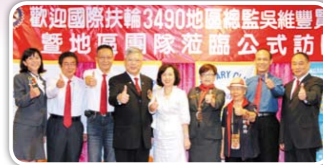
姑爺們的加入使新南社女子軍團的力量更強大