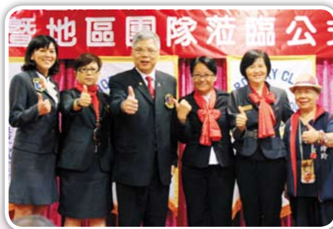
新社友Life宣誓入社 扶輪大家庭歡迎您