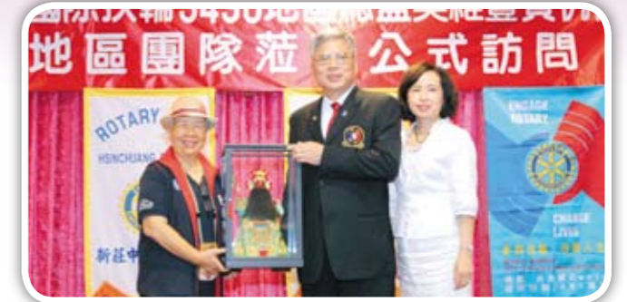
C.P Mayor致贈一尊象徵忠孝節義的關公神像予總監