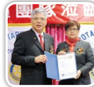
總監頒發2013-14年度職務聘書予社長