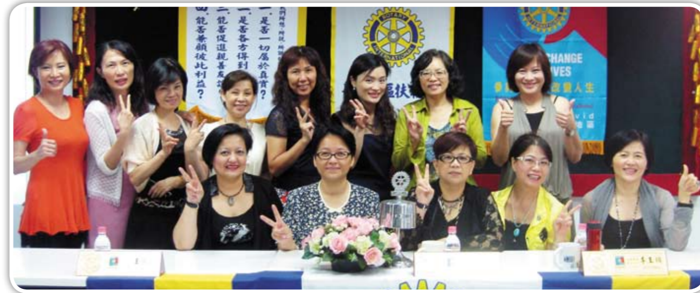
新莊南區扶輪社 喔 YA!