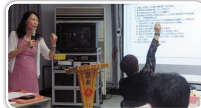
請姐妹們多多支持公益網把愛傳遞下去