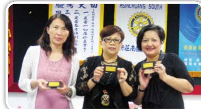
感謝社長致贈生日禮物給9月份的壽星