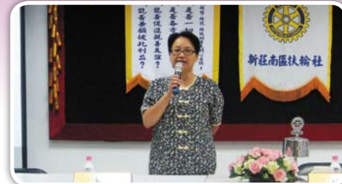
分享時很容易緊張的Life姐妹們都為你加油