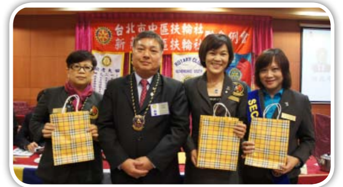
台北中區社P.Alien為三位美女們準備的小禮物 So Sweet!