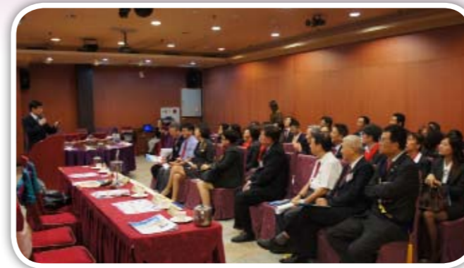
社友踴躍出席專題演講