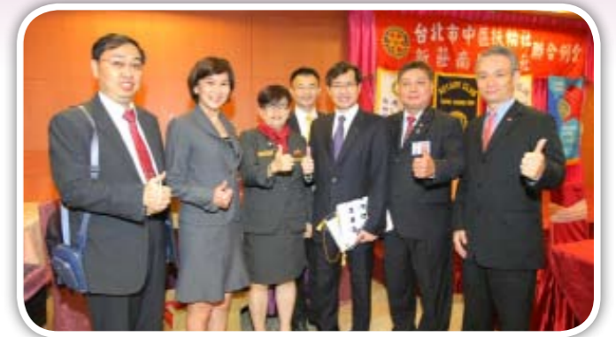
台北市中區社暨新南社 聯合例會 圓滿成功!