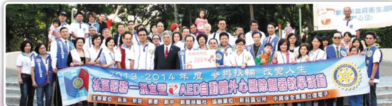
五社聯合社區服務 圓滿成功