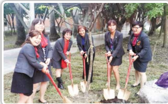
新社館落成，植樹祈福儀式