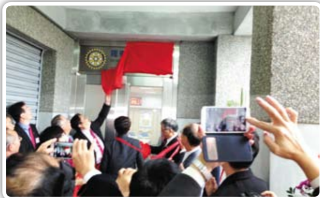
揭幕儀式 恭喜友好社羅東中區社【新社館啟用典禮】