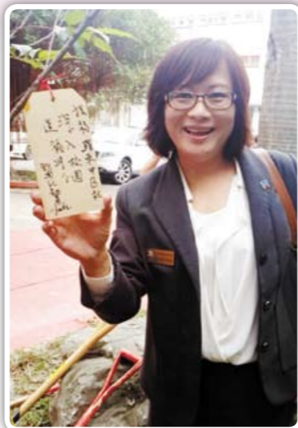
祝福羅東中區社 深入校園，造福學生 成立【羅東高工扶輪少年服務團】