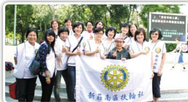
感謝C.P Mayor也為此活動站台