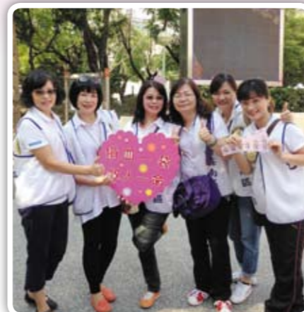
定期捐血可促進身體新陳代謝，又可幫助別人