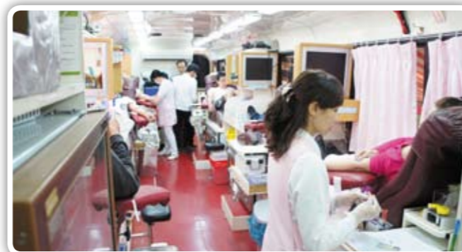
捐血實況-座無虛席