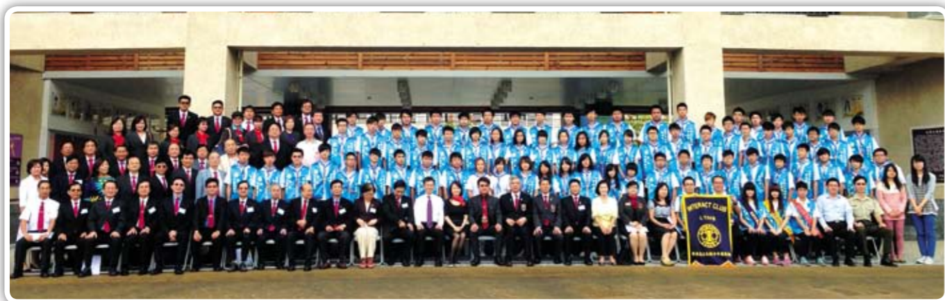
恭喜 友好社羅東中區社成立羅東高工扶少團