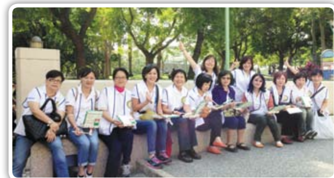
新南社美女們 做愛心不落人後