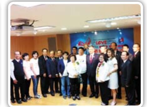
11/8【愛·輪轉慈善音樂會】勸募款項捐贈記者會