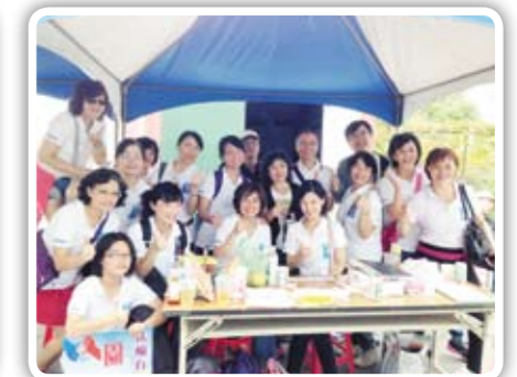
美女們辛苦了一整天