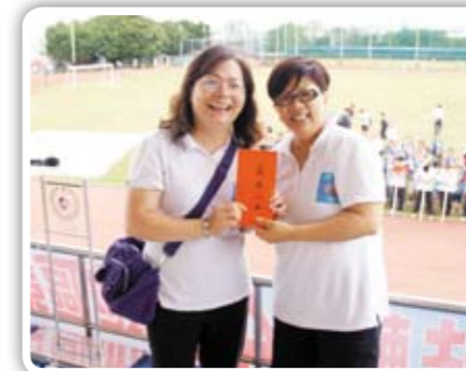
九宮格投球樂新南得第一