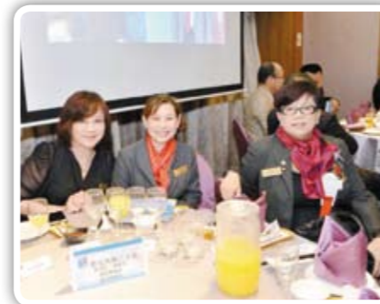
11/7 三重中央扶輪社25周年慶典