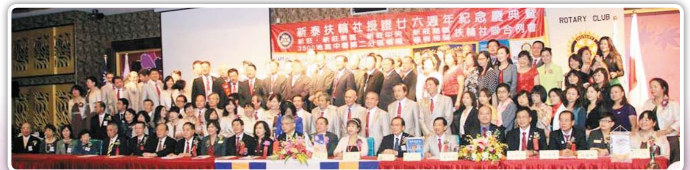
11/9 新泰扶輪社26周年慶典