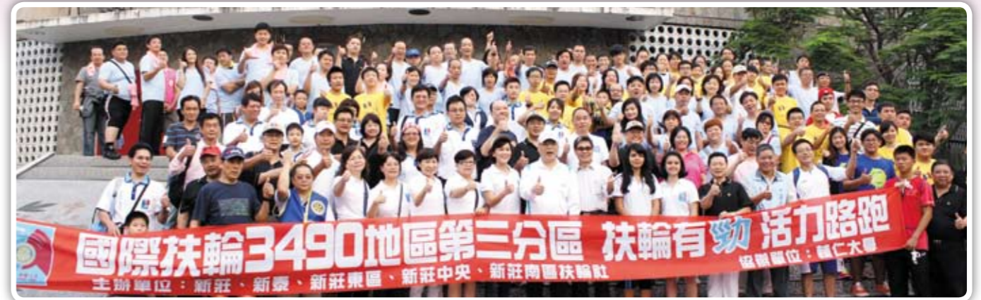
扶輪有勁 活力路跑