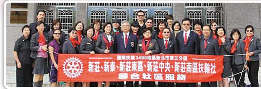
第三分區 五社聯合社區服務 圓滿成功!