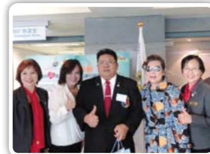
感謝社友及扶輪先進對社福團體的支持