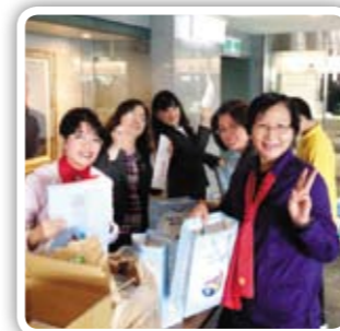
新南姊妹今天辛苦了！