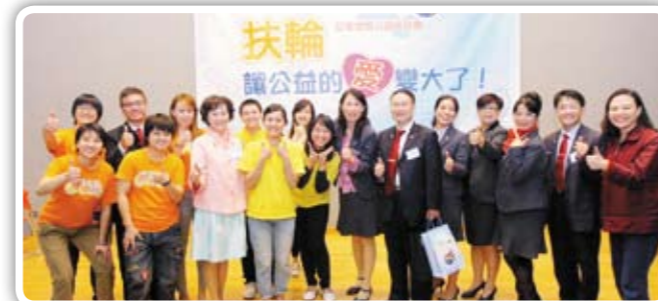
20幾家社福團體出席18日扶輪，讓公益的愛變大了記者會，對扶輪公益網成為社福的後盾表達高度肯定