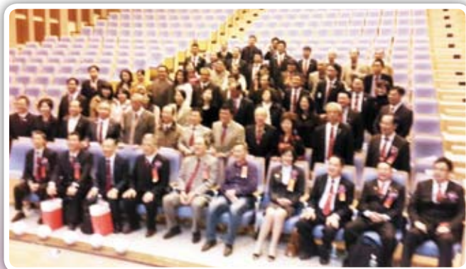
參與扶輪 改變人生 圓滿成功!