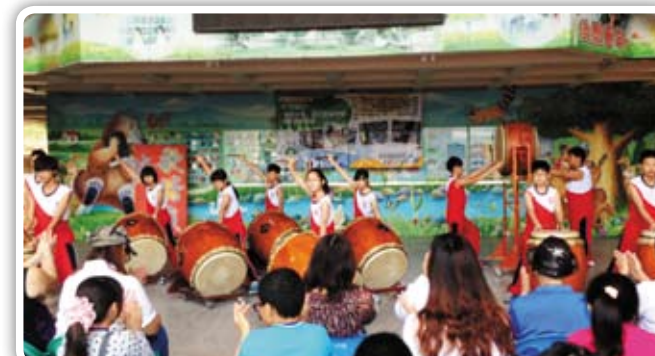
新莊南區社贊助歐鼓特青少年鼓藝團發揚在地文化