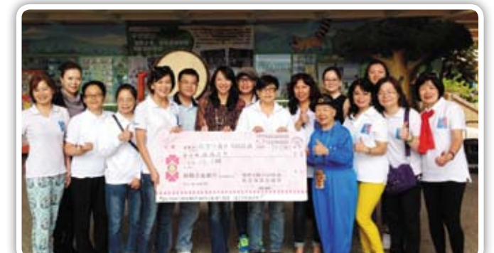
C.P Mayor、A.G Tiffany、社長代表新南社捐贈2萬元予歐鼓特鼓藝團,由校長代表接受。