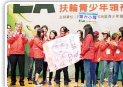
新南社派出參加的RYLA子女第六隊勇奪晚會表演第一名,表演的好棒!!