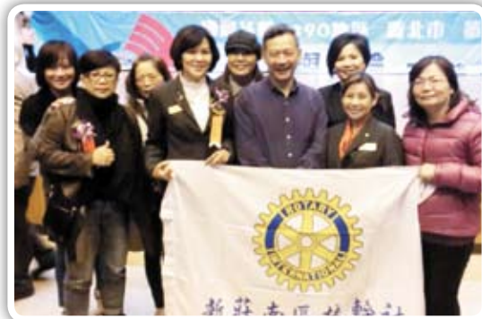
沈博士:把工作當成冒險,用不同的角度,創造不同的人生觀,享受過期,改變人生