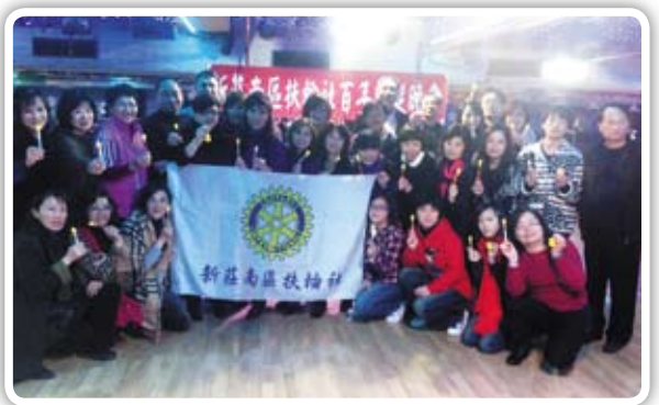
玩遊戲拿獎金，感謝Dancer老師贊助遊戲獎金、新南社贊助遊戲獎品黃色小鴨