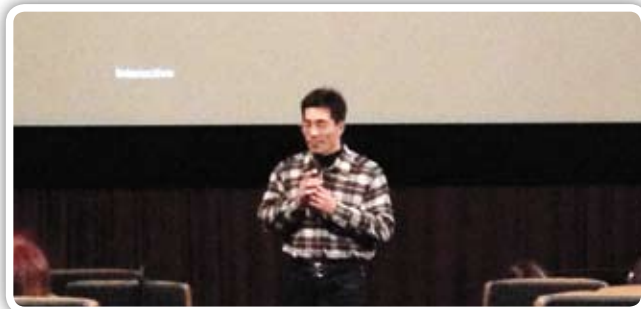
更生人分享，更警惕學子們，跟毒品說“NO”