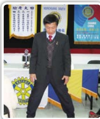
林口扶輪社PP Handsome 示範返老還童呼吸法