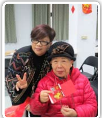
新春團拜猜燈謎活動，新南社準備20個紅包，大家樂開懷