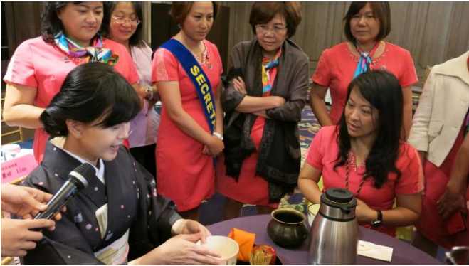
佩萱老師示範茶道禮儀