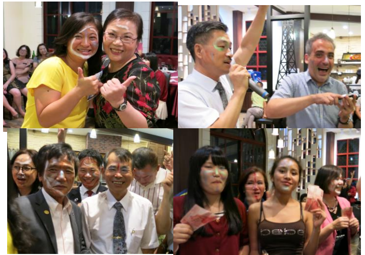
粉墨登場樂開懷~~哈哈！